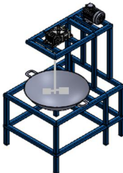
Gambar 3. Desain Mesin Pengaduk Madumongso

Mesin yang akan digunakan untuk mendukung program peningkatan produktifitas UKM Kue Madu Mongso Bu Surti adalah mesin pengaduk adonan atau mesin Pengaduk dengan RPM 1800, pemutar menggunakan motor listrik 0,5 PK, terhubung dengan poros pengaduk menggunakan pully dan belt bahan pengaduk menggunakan bahan stenlish. Wajan yang digunakan adalah wajan tidak lengket berdiameter 50 cm dan bias diambil . Tinggi mesin 50 mm, dudukan bawah berukuran 40cmx40 cm x 40 cm dan terdapat dudukan plat. Untuk menurunkan rpm menggunakan reducer dan pully. Panas berasal dari kompor gas yang bias diatur panasnya. Desain mesin pengaduk dapat dilihat pada Gambar 3.