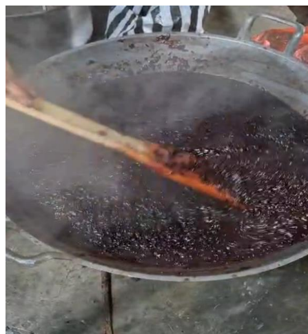
Gambar 2. Pemasakan Madu Mongso Masih Manual

Permasalahan-permasalahan tersebut menyebabkan rendahnya produktivitas dan konsistensi mutu produk. Padahal, dengan inovasi sederhana seperti mesin pengaduk, efisiensi waktu dan kapasitas produksi dapat meningkat signifikan [13]. Hal ini terbukti pada program sejenis yang berhasil meningkatkan produktivitas UKM hingga 50% setelah penerapan alat mekanis [14]. Oleh karena itu, solusi yang ditawarkan oleh tim PKM adalah penerapan mesin pengaduk Madumongso semi otomatis. Mesin ini tidak hanya berfungsi sebagai alat bantu produksi, tetapi juga menjadi model pembelajaran teknologi tepat guna yang mampu memperkuat daya saing UKM pangan lokal [15]. Pengadukan bahan saat produksi masih sangat sederhana, sehingga kondisi tersebut tampak jelas pada proses pemasakan yang dilakukan mitra seperti ditunjukkan pada Gambar 2.