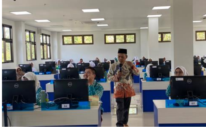
Gambar 4. Diskusi Kelompok dan Sharing Best Practice pada Sistem