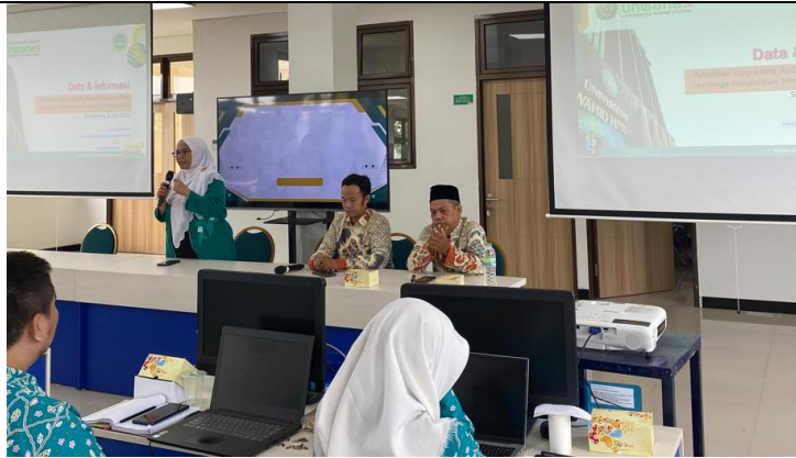
Gambar 2. Workshop Pelatihan Upgrading Aplikasi Pangkalan Data oleh PWNU Jateng dan Di damping para dosen progra studi Teknik Informatika Unwahas