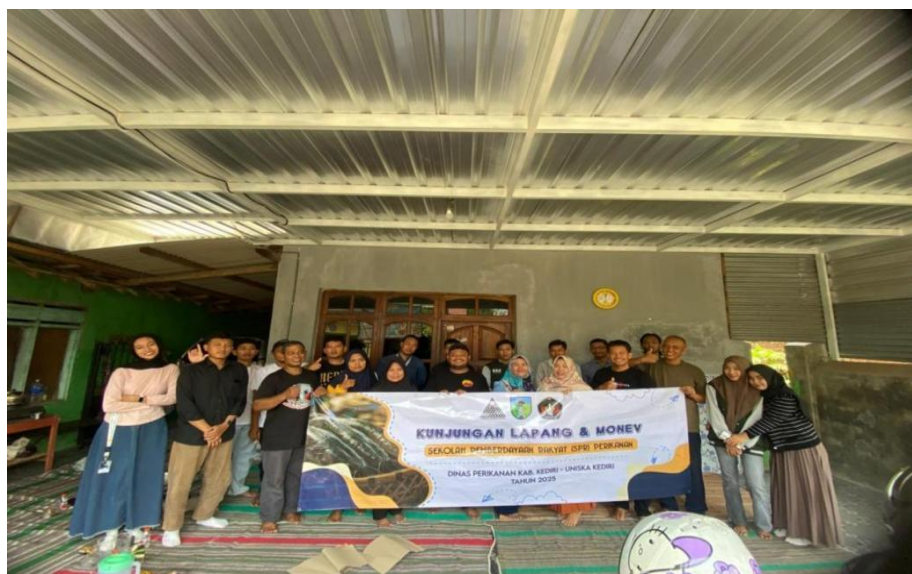
Gambar 4. Kegiatan Diakhiri dengan Foto Bersama Kelompok Sahity Mulya Banyakan dan Mahasiswa KKN Uniska

Pelatihan manajemen pemasaran produk perikanan pada kelompok pembudidaya Sahity Mulya ini merupakan penerapan community-based entrepreneurship yang fokus pada pemberdayaan komunitas lokal melalui peningkatan kapasitas usaha dan kemandirian, serta digital empowerment dengan pemanfaatan media sosial dan marketplace sebagai alat pemasaran digital yang memperluas akses pasar dan meningkatkan daya saing produk. Pendekatan ini memadukan pengembangan keterampilan teknis dan manajerial peserta sehingga mereka mampu menciptakan produk bernilai tambah dan memperkuat keberlanjutan ekonomi lokal secara inovatif dan berkelanjutan, sekaligus meningkatkan kesejahteraan masyarakat desa secara kolektif. Kegiatan pelatihan ini dilaksanakan secara partisipatif dengan melibatkan peserta dalam diskusi dan praktik langsung yang berkaitan dengan pemasaran produk perikanan. Dokumentasi pelaksanaan kegiatan pelatihan bersama kelompok pembudidaya dan mahasiswa pendamping ditunjukkan pada Gambar 4.