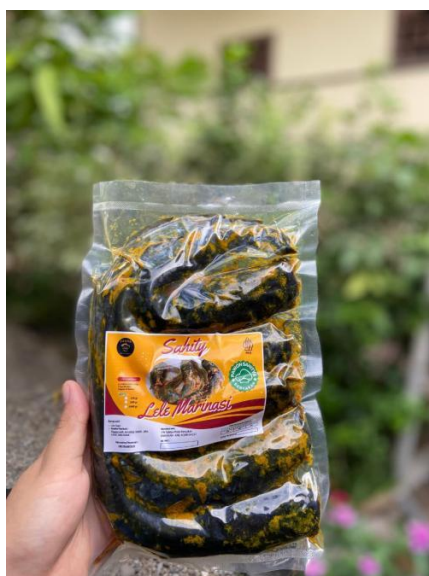
Gambar 4. Produk Marinasi Lele Sahity

Berdasarkan Tabel 2, produk turunan ikan lele dalam bentuk marinasi lele memiliki jumlah peminat paling banyak dibandingkan produk lainnya. Produk ini dipilih karena dinilai memiliki proses pengolahan yang relatif mudah dan peluang pemasaran yang luas. Produk marinasi lele dikemas dan diberi identitas sesuai dengan kesepakatan kelompok. Produk dan kemasan marinasi lele Sahity ditunjukkan pada Gambar 4.