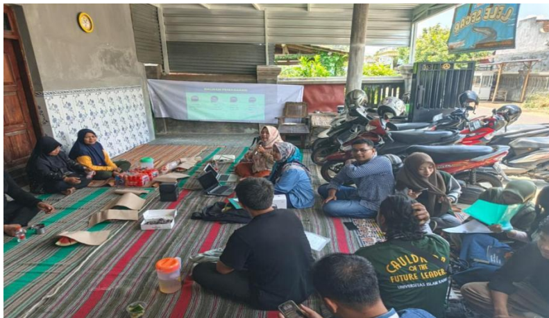
Gambar 2. Proses Penyampaian Materi dilanjutkan Sesi Tanya Jawab dengan Peserta

Pemateri menjalankan 3 (tiga) langkah penyampaian materi, yaitu apersepsi dan pra-asesmen, kegiatan inti dan sesi tanya jawab, yang kemudian ditutup dengan pemberian tugas membuat sampel produk turunan ikan lele serta pemasaran melalui media sosial masing-masing anggota kelompok. Manfaat pelatihan ini sangat signifikan, diantaranya meningkatkan pengetahuan dan keterampilan peserta dalam strategi pemasaran digital, pengemasan produk dan diversifikasi produk olahan ikan lele, ini tentunya dapat meningkatkan nilai ekonomi dan daya saing produk [11], [12]. Selain itu, pelatihan ini membantu pembudidaya ikan lele mengoptimalkan pemanfaatan media sosial dan marketplace untuk memperluas akses pasar secara berkelanjutan, sekaligus membentuk sikap kewirausahaan yang responsif terhadap tantangan pasar modern [13]. Proses penyampaian materi dan sesi tanya jawab dengan peserta ditunjukkan pada Gambar 2.