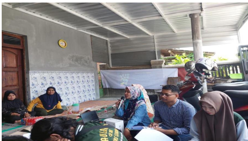
Gambar 3. Moderator Melakukan Evaluasi dan Monitoring dengan Peserta

Pada tahap ini, peserta diminta memberikan tanggapan dan saran terkait kegiatan yang diikuti. Kemudian peserta juga diberikan kesempatan menanyakan tugas yang diberikan oleh pemateri. Pemateri juga menampilkan beberapa contoh produk turunan ikan lele. Jadi indikator keberhasilan kegiatan ini diukur pada pemahaman masing-masing anggota untuk membuat produk turunan ikan lele secara bersama-sama dan menggunakan brand Sahity untuk penamaan merek produk. Proses monitoring dan evaluasi kegiatan ditunjukkan pada Gambar 3.