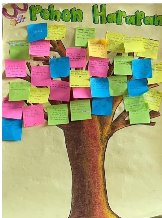
Gambar 3. "Pohon Harapan" sebagai Media Reflektif

Pada bagian akhir, siswa melakukan kegiatan "Pohon Harapan", di mana mereka menulis harapan atau pesan yang berkaitan dengan hubungan mereka dengan teman-teman mereka di sekolah. Tulisan siswa beragam, termasuk keinginan untuk membuat lingkungan kelas lebih ramah, menghargai satu sama lain, dan ingin mempertahankan hubungan baik dengan teman-teman mereka. Pernyataan-pernyataan tersebut menunjukkan bagaimana siswa menulis tentang materi sosialisasi. Kegiatan "Pohon Harapan" ini ditampilkan pada Gambar 3 sebagai media reflektif bagi siswa.