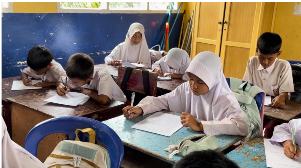
Gambar 2. Pengisian Pre-Test/Post-Test

untuk menghargai perbedaan kemampuan, sifat, maupun latar belakang siswa lain mencapai 100%, menandakan bahwa kegiatan ini turut membentuk nilai empati dan kepedulian. Proses pengisian pre-test dan post-test oleh siswa ditunjukkan pada Gambar 2.