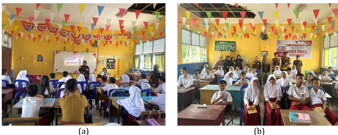
Gambar 4. Sosialisasi “Stop Bullying” (a) dan Foto Bersama antara Anggota KUKERTA MBKM dan Siswa/i Kelas VI SDN 166 Pekanbaru (b)

Kontribusi kegiatan ini juga tampak pada perubahan cara pandang siswa mengenai lingkungan sekolah. Mereka mulai memahami bahwa setiap individu memiliki tanggung jawab dalam menciptakan lingkungan belajar yang aman. Beberapa siswa menyampaikan bahwa mereka akan mencoba lebih berhati-hati dalam bertutur kata, lebih peka terhadap perasaan teman, dan berusaha menghindari perilaku yang dapat menyakiti orang lain. Sikap-sikap seperti ini menunjukkan bahwa kegiatan sosialisasi berhasil membangun pemahaman kolektif mengenai pentingnya saling menghormati dan mendukung teman sebaya.