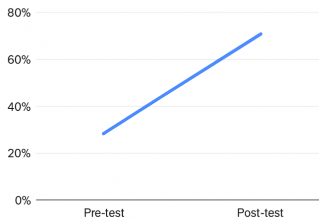
Gambar 1. Grafik Peningkatan Pemahaman Literasi Keuangan Peserta