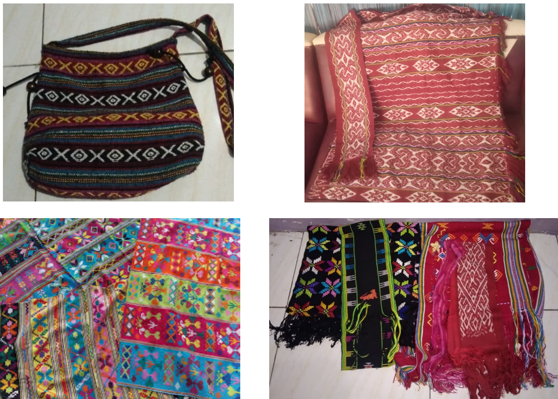
Gambar 3. Contoh Produk Tenun Ikat Hasil Pengembangan dan Diversifikasi

Perubahan tersebut menunjukkan bahwa kegiatan pengabdian ini memberikan dasar awal bagi penguatan kapasitas ekonomi penenun. Dengan peningkatan pemahaman mengenai pengelolaan usaha dan diversifikasi produk, penenun diharapkan memiliki kesiapan yang lebih baik untuk mengembangkan usaha tenun ikat secara berkelanjutan pada tahap selanjutnya. Variasi luaran produk yang muncul serta kemampuan awal penenun untuk menetapkan harga yang lebih rasional sesuai biaya produksi dan nilai budaya yang melekat pada produk tenun menunjukkan keberhasilan awal dalam proses pendampingan ini. Contoh beberapa luaran produk tenun ikat hasil pengembangan dan diversifikasi ditampilkan pada Gambar 3.