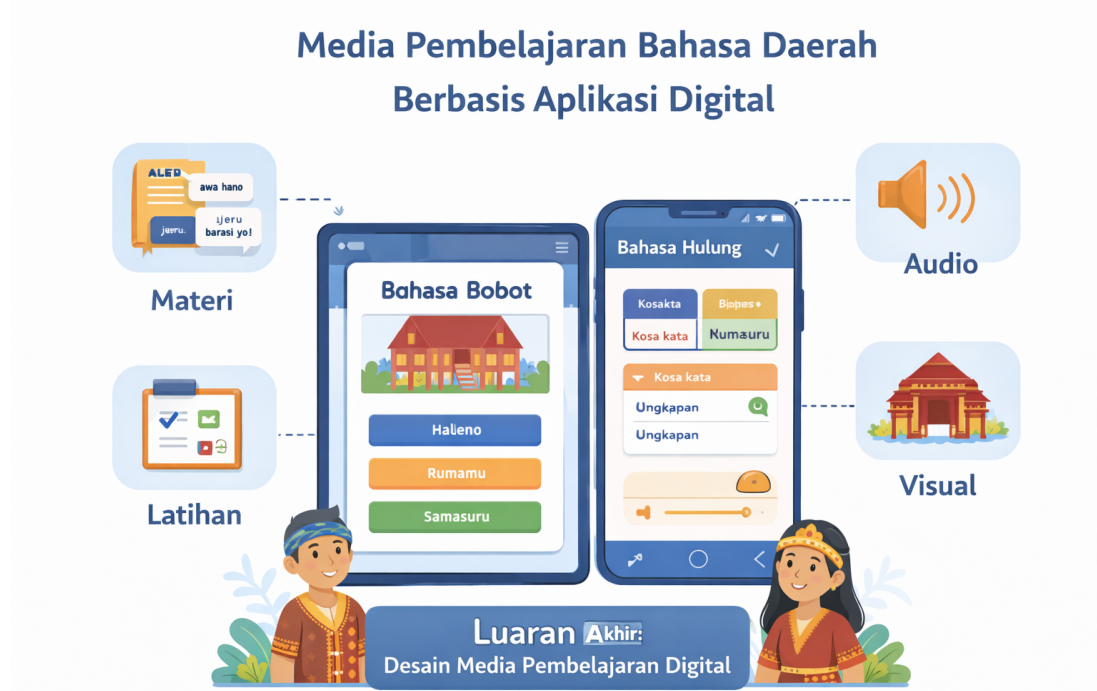
Gambar 1. Struktur Media Pembelajaran Bahasa Daerah Digital Tabel 3. Spesifikasi Luaran Media Pembelajaran