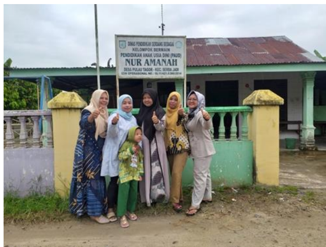
Gambar 1. Lokasi Pengabdian