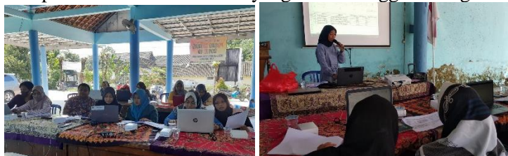
Gambar 3. Kegiatan Pelatihan Manajemen File dan Microsoft Word

Berdasarkan hasil survei, observasi dan wawancara dapat diidentifikasi permasalahan yang terjadi yaitu staff administrasi desa dan anggota lembaga desa yaitu BPD, PKK, LPKMD, Karang Taruna belum mempunyai kemampuan yang merata dalam menggunakan microsoft word dan manajemen file di komputer. Oleh karena itu terkadang untuk pekerjaan yang berkaitan dan berhubungan dengan komputer dilakukan oleh staf yang bisa sehingga kurang efisiensi waktu.