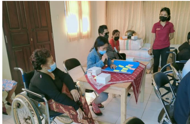
Gambar 8 Peserta presentasi BMC yang dibuat

Gambar 8 menunjukkan peserta sedang melakukan presentasi hasil kerja kelompok yang telah dilakukan. Dari presentasi yang dilakukan diketahui bahwa peserta telah mampu menjelaskan tentang 9 elemen pada BMC, dan mampu merumuskan secara tepat isi dari setiap elemen-elemen tersebut. Setelah selesai materi pengembangan usaha melalui pemodelan usaha menggunakan BMC dilanjutkan dengan pelatihan pencatatan keuangan.