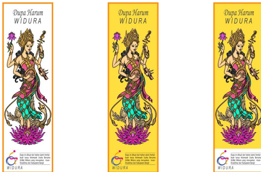
Gambar 11. Desain label kemasan Dupa KuBE Widura

Gambar 10 merupakan desain logo KuBE Widura yang telah dirancang untuk dapat digunakan pada setiap produk yang dimikiki. Pada logo terdapat seseorang yang duduk diatas roda dengan tangan seolah menggerakkan roda untuk berjalan maju, yang merepresentasikan bahwa pelaku usaha penyandang disabilitas dapat bergerak secara dinamis untuk memajukan usahanya. Tulisan WIDURA dibuat miring kedepan sebagai bentuk keselarasan dengan gambar diatasnya yang bergerak maju kedepan. Diharapkan logo ini mampu memberikan semangat baru kepada KuBE Widura dalam pengembangan usahanya.