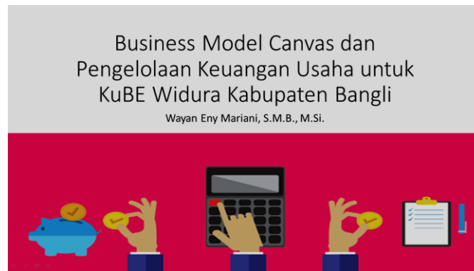
Gambar 6. Slide materi pelatihan BMC dan pencatatan keuangan usaha

Gambar 6 merupakan slide materi pelatihan BMC dan pencatatan keuangan usaha. Setelah dilakukan pemaparan terhadap materi selanjutnya dilakukan diskusi Tanya jawab dengan peserta, yang dilanjutkan dengan membentuk kelompok yang terdiri dari 4 orang untuk memodelkan sebuah usaha menggunakan BMC.