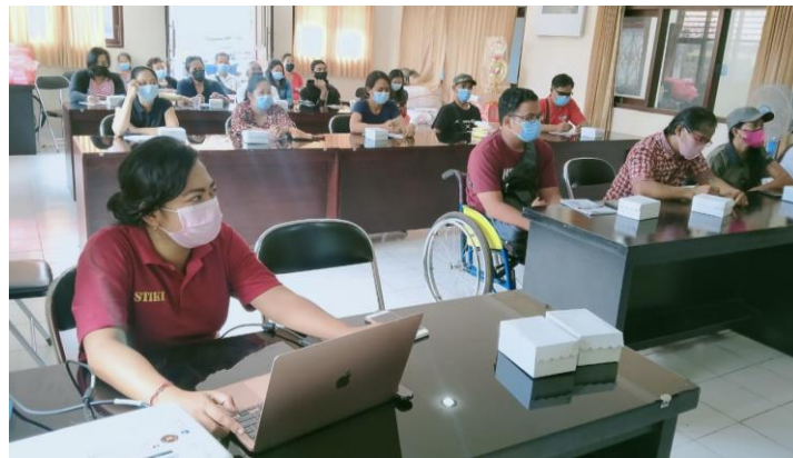
Gambar 4. Pelaksanaan Pelatihan

Gambar 4 menunjukkan kegiatan pelatihan sedang berlangsung. Pelatihan bertempat di Aula Dinas Sosial Kabupaten Bangli yang berada di lantai 1 sehingga peserta yang tergolong disabilitas dapat mengakses dengan mudah. Kegiatan pelatihan dilakukan secara tatap muka sehingga dalam pelaksanaannya menerapkan protocol kesehatan Covid-19 yang sangat ketat. Walaupun demikian antusias peserta sangat tinggi. Hal ini dapat dilihat dari kesediaannya untuk dapat menghadiri kegiatan pelatihan walaupun memiliki keterbatasan fisik. Selain itu kegiatan ini juga mendapat dukungan yang sangat baik dari keluarga peserta. Ini ditunjukkan dari kesediaan keluarga untuk mengantarkan peserta ke lokasi pelatihan dan menunggu sampai kegiatan pelatihan selesai. Pengantaran dilakukan karena peserta tidak dapat hadir secara mandiri ke lokasi pelatihan, sehingga perlunya bantuan anggota keluarga untuk menemani.