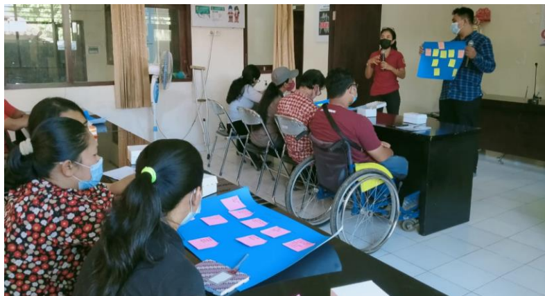
Gambar 5. Pelatihan Bussiness Model Canvas

Gambar 4 menunjukkan kegiatan pelatihan sedang berlangsung. Pelatihan bertempat di Aula Dinas Sosial Kabupaten Bangli yang berada di lantai 1 sehingga peserta yang tergolong disabilitas dapat mengakses dengan mudah. Kegiatan pelatihan dilakukan secara tatap muka sehingga dalam pelaksanaannya menerapkan protocol kesehatan Covid-19 yang sangat ketat. Walaupun demikian antusias peserta sangat tinggi. Hal ini dapat dilihat dari kesediaannya untuk dapat menghadiri kegiatan pelatihan walaupun memiliki keterbatasan fisik. Selain itu kegiatan ini juga mendapat dukungan yang sangat baik dari keluarga peserta. Ini ditunjukkan dari kesediaan keluarga untuk mengantarkan peserta ke lokasi pelatihan dan menunggu sampai kegiatan pelatihan selesai. Pengantaran dilakukan karena peserta tidak dapat hadir secara mandiri ke lokasi pelatihan, sehingga perlunya bantuan anggota keluarga untuk menemani.