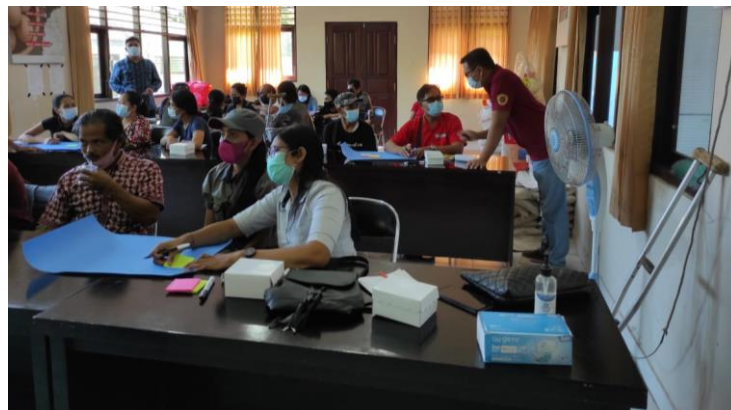
Gambar 3. Kehadiran peserta pelatihan

Pelaksanaan Pelatihan dilakukan di Aula Dinas Sosial Kabupaten Bangli dengan mengundang pelaku usaha KuBE Widura. Pelaksanaan kegiatan pelatihan mengumpulkan orang dalam jumlah terbatas dan menerapkan protokol kesehatan Covid-19 yang ketat. Ruang tidak menggunakan AC dengan kondisi jendela dalam keadaan terbuka sehingga ventilasi dan sirkulasi udara di dalam ruangan dapat berjalan lancar.