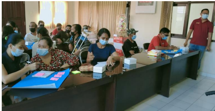
Gambar 7. Diskusi kelompok pemodelan bisnis dengan BMC

Gambar 6 merupakan slide materi pelatihan BMC dan pencatatan keuangan usaha. Setelah dilakukan pemaparan terhadap materi selanjutnya dilakukan diskusi Tanya jawab dengan peserta, yang dilanjutkan dengan membentuk kelompok yang terdiri dari 4 orang untuk memodelkan sebuah usaha menggunakan BMC.