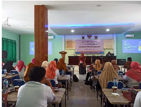
Gambar 2. Pemberian materi terkait impact counselling