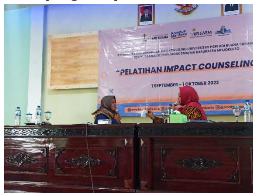
Gambar 3 Simulasi contoh implementasi impact counselling