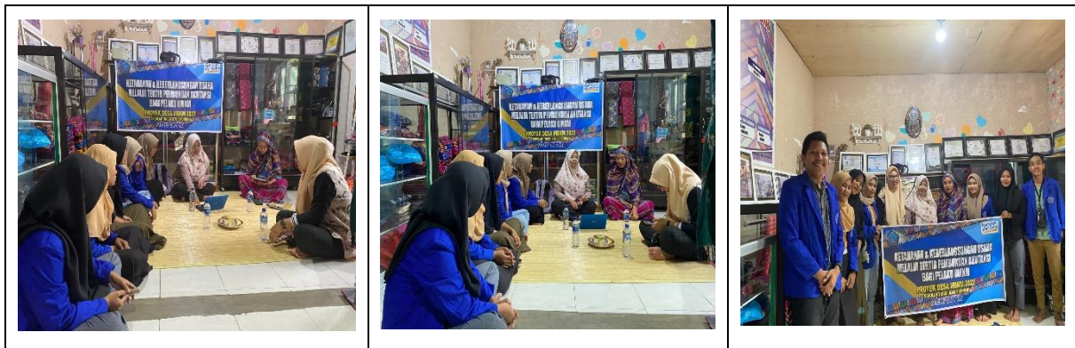
Gambar 2 Tahap Pelatihan

formatnya kemudian diajarkan bagaimana mengisi dari mulai tanggal transaksi, jenis transaksi dan nominalnya. Untuk sesi terakhir adalah memberikan kesempatan pelaku UMKM untuk membuat pembukuan sesuai dengan transaksi yang ada pada hari itu. Hasil dari kegiatan pelatihan menunjukkan bahwa para peserta mampu memahami dan menerapkan pembukuan sederhana dengan baik. Mereka juga mampu mengaplikasikan ilmu yang didapatkan selama pelatihan ke dalam kegiatan usaha mereka pada hari itu.