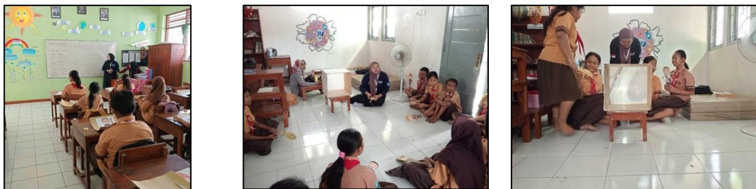
Gambar 5. Refleksi Kegiatan Wayang Budaya

Evaluasi pelaksanaan kegiatan menunjukkan bahwa kegiatan ini berhasil meningkatkan literasi budaya siswa. Observasi selama kegiatan menunjukkan bahwa siswa dapat memahami nilai-nilai budaya yang terkandung dalam wayang, seperti toleransi, kerjasama, dan penghargaan terhadap perbedaan. Sebagian besar siswa dapat mengidentifikasi nilai-nilai ini dan mendiskusikannya dalam konteks kehidupan sehari-hari. Peningkatan rasa percaya diri siswa, terutama dalam berbicara di depan umum dan berperan sebagai dalang, menjadi salah satu pencapaian utama dari program ini. Kegiatan yang menggabungkan elemen budaya dan keterampilan berbicara di depan umum dapat mengembangkan kepercayaan diri siswa dan memperkuat karakter [9].