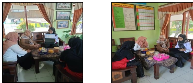
Gambar 2. Koordinasi dengan pihak sekolah

Pelaksanaan kegiatan pengenalan wayang kepada siswa SD Negeri 1 Beji telah dilaksanakan dengan baik dan terstruktur. Pada tahap perencanaan, penentuan tema yang jelas dan tujuan yang spesifik menjadi fondasi penting dalam menyusun kegiatan ini. Tema "Wayang Budaya: Pengenalan dan Pemahaman Budaya Tradisional Indonesia untuk Meningkatkan Literasi" dipilih dengan mempertimbangkan relevansi wayang sebagai salah satu warisan budaya yang kaya akan nilai-nilai moral dan sosial. Koordinasi yang baik dengan pihak sekolah, termasuk guru kelas V, memastikan kelancaran pelaksanaan kegiatan, karena pihak sekolah memberikan dukungan penuh dari segi waktu, fasilitas, dan tenaga pengajar.