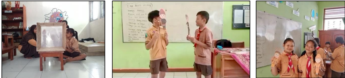
Gambar 4. Pembuatan wayang oleh siswa kelas V SDN 1 Beji

mencari kesepakatan, dan menyampaikan pendapat dalam kelompok. Hasil penelitian sebelumnya menunjukkan bahwa pembelajaran kolaboratif memiliki potensi untuk meningkatkan keterampilan sosial siswa [8]. Dengan menggunakan wayang yang telah dibuat, siswa mampu mengekspresikan ide dan menghadirkan pesan moral yang terkandung dalam cerita.