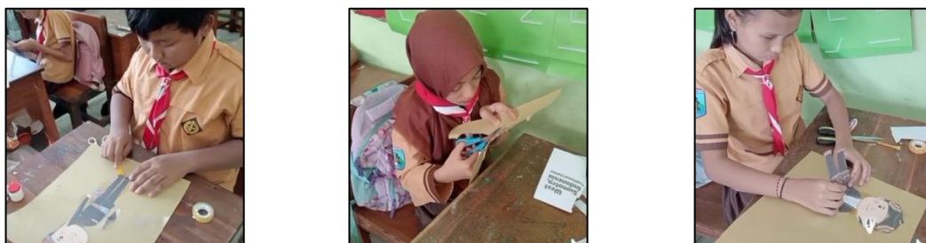
Gambar 3. Pembuatan wayang oleh siswa kelas V SDN 1 Beji

Pada sesi pembuatan wayang, siswa menunjukkan antusiasme yang tinggi. Meskipun beberapa siswa memerlukan bimbingan lebih dalam aspek teknis, mayoritas siswa dapat mengikuti petunjuk dengan baik. Kegiatan ini memberi siswa kesempatan untuk mengasah keterampilan motorik halus, seperti memotong kertas dan menyusun wayang. Keterlibatan siswa dalam aktivitas praktis seperti pembuatan wayang dapat meningkatkan kreativitas serta mendalami pemahaman terhadap budaya yang diajarkan. Ini terlihat dari keinginan siswa untuk berinovasi dalam desain wayang yang dibuat, menciptakan karakter-karakter yang unik dan menarik.