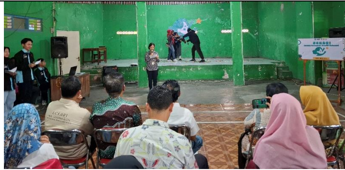
Gambar 3. Drama Musikal Perlindungan Diri

Kegiatan dilanjutkan dengan pemaparan materi edukasi perlindungan diri bagi perempuan oleh DP3AP2KB Provinsi Jawa Tengah kemudian dilanjutkan pelatihan gerakan-gerakan dasar Muay Thai yang diajarkan oleh Training Camp Naga Ulung.