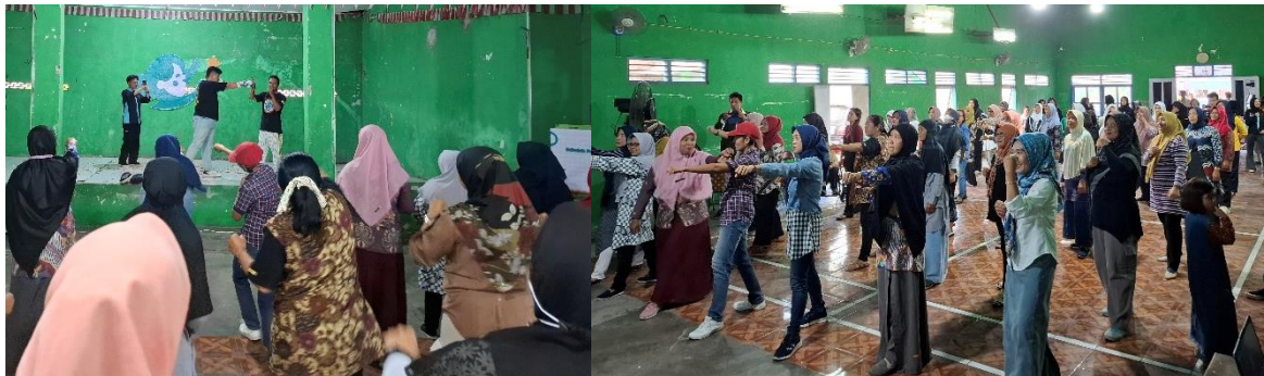
Gambar 4. Praktik Pelatihan Muay Thai

Kegiatan dilanjutkan dengan pemaparan materi edukasi perlindungan diri bagi perempuan oleh DP3AP2KB Provinsi Jawa Tengah kemudian dilanjutkan pelatihan gerakan-gerakan dasar Muay Thai yang diajarkan oleh Training Camp Naga Ulung.