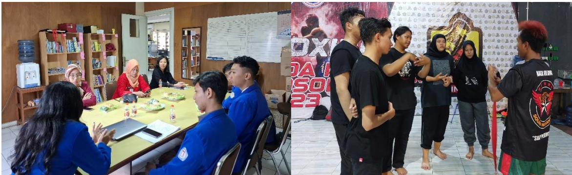
Gambar 2. FGD bersama Dinas Perempuan dan Anak Provinsi Jateng dan Training Camp Muay Thai Naga Ulung

Kegiatan pengabdian ini perlu komunikasi dan monitoring dari pihak yang paling berwenang terhadap pemberdayaan perempuan yaitu Dinas Perempuan dan Anak (DP3AP2KB) Provinsi Jawa Tengah supaya materi pemberdayaan yang diberikan tepat dan sejalan dengan program pemerintah nasional. Kemudian, tim pengabdian melakukan kemitraan juga dengan Training Camp Naga Ulung untuk coaching pelatihan bela diri Muay Thai.