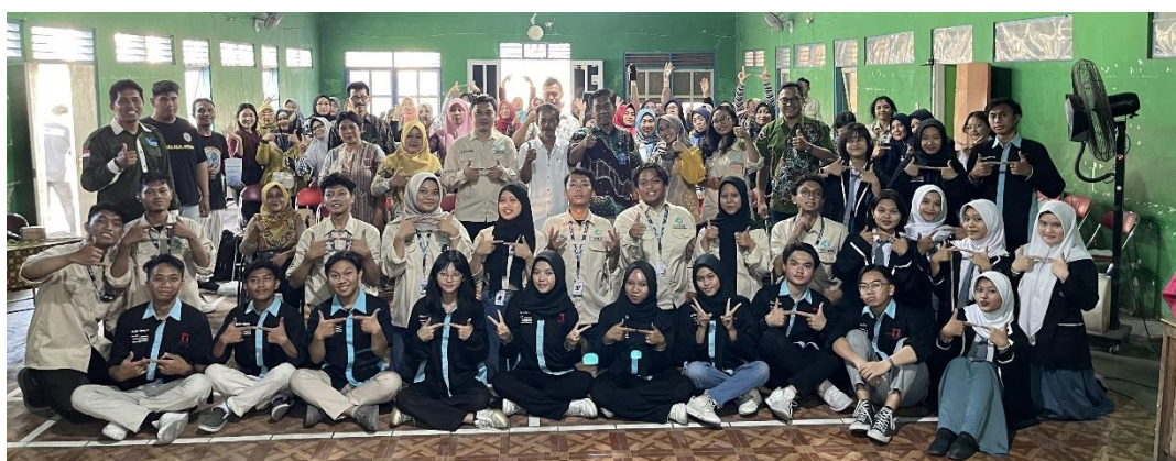
Gambar 5. Dokumentasi Foto Bersama

Gerakan dasar yang diajarkan oleh coach dari Training Camp Naga Ulung meliputi cara melepaskan diri apabila tiba-tiba dijepit di bagian leher oleh pelaku tindak kriminal, atau yang biasa disebut oleh masyarakat Semarang dengan “dipiting”. Gerakan kedua adalah gerakan meninju dengan teknik Muay Thai supaya dengan tenaga perempuan tetap bisa melawan pelaku tindak kriminal yang kemungkinan lebih besar perawakannya.