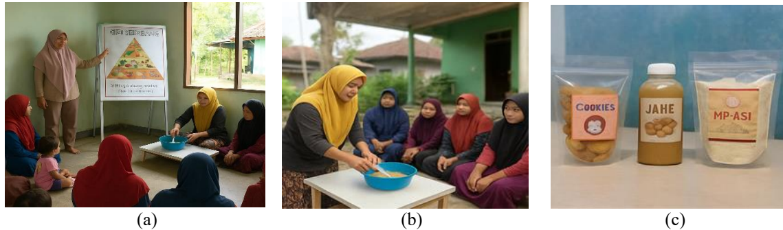
Gambar 2. Dokumentasi Kegiatan (a) Edukasi Gizi Seimbang di Posyandu, (b) Demonstrasi Pengolahan Pangan Lokal (c) Produk Olahan Pangan Sehat Hasil Usaha Keluarga

bahan pangan lokal yang mudah didapat di sekitar wilayah posyandu. Namun, keterbatasan modal awal dan sarana produksi menjadi kendala utama bagi sebagian keluarga untuk mempertahankan usaha setelah program selesai. Beberapa keluarga juga mengalami kesulitan mengatur waktu antara kegiatan rumah tangga dan produksi, terutama ibu dengan balita kecil. Untuk memperkuat hasil kuantitatif, dokumentasi lapangan juga dikumpulkan. Dokumentasi ini menampilkan proses edukasi, praktik pemanfaatan pangan lokal, hingga produk olahan pangan sehat yang dihasilkan oleh keluarga peserta. Dokumentasi tersebut disajikan pada Gambar 2.