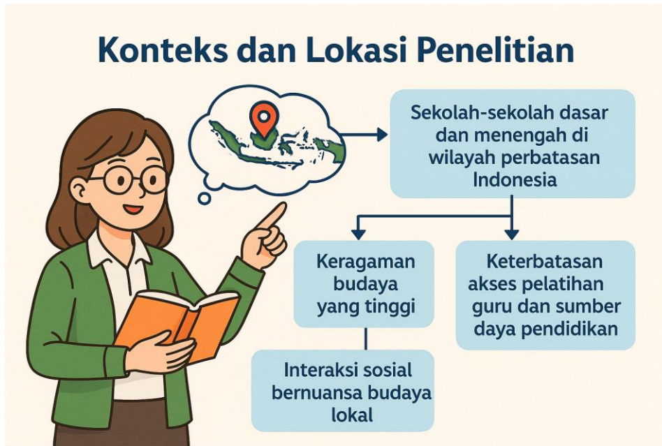
Gambar 1. Kerangka Pemikiran Konteks dan Lokasi Penelitian dalam Pendidikan Multikultural di Wilayah Perbatasan

kondisi geografis dan sosiokultural wilayah 3T (terdepan, terluar, tertinggal) memengaruhi praktik pendidikan multikultural. Visualisasi ini menekankan hubungan antara keberagaman budaya, keterbatasan akses pendidikan, serta interaksi sosial yang dipenuhi oleh nuansa budaya lokal sebagai elemen penting yang membentuk dinamika pembelajaran di kelas.