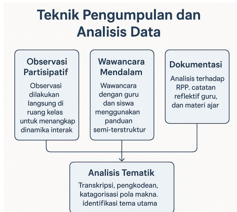
Gambar 2. Alur Visual Teknik Pengumpulan dan Analisis Data Multikultural