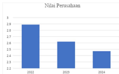
Gambar 1.1 Nilai Perusahaan Subsektor Makanan dan Minuman Periode 2022-2024

Nilai perusahaan pada subsektor makanan dan minuman menunjukkan kecenderungan menurun sepanjang periode 2022-2024. Pencapaian tertinggi terjadi pada tahun 2022, kemudian diikuti oleh penurunan bertahap hingga tahun 2024. Pola tersebut merefleksikan perubahan persepsi pasar terhadap kemampuan perusahaan dalam mempertahankan kinerja serta menciptakan prospek pertumbuhan yang berkelanjutan. Kecenderungan penurunan ini dapat diasosiasikan dengan kombinasi faktor internal dan eksternal. Dari sisi internal, keputusan terkait struktur modal, tingkat likuiditas, efektivitas pemanfaatan aset, serta kebijakan dividen berpotensi memengaruhi kepercayaan investor dan ekspektasi terhadap arus kas masa depan. Sementara itu, dari sisi eksternal, intensitas persaingan industri, tekanan biaya, serta dinamika permintaan pasar turut memperbesar tingkat ketidakpastian yang dihadapi perusahaan. Tidak ditemukannya indikasi pemulihan dalam periode pengamatan mengisyaratkan bahwa tekanan terhadap nilai perusahaan bersifat persisten. Oleh karena itu, diperlukan analisis yang lebih komprehensif terhadap kinerja keuangan dan strategi pengelolaan perusahaan guna mengidentifikasi variabel-variabel yang secara signifikan berkontribusi terhadap perubahan nilai tersebut, sekaligus merumuskan langkah perbaikan yang lebih terarah dan berkelanjutan.