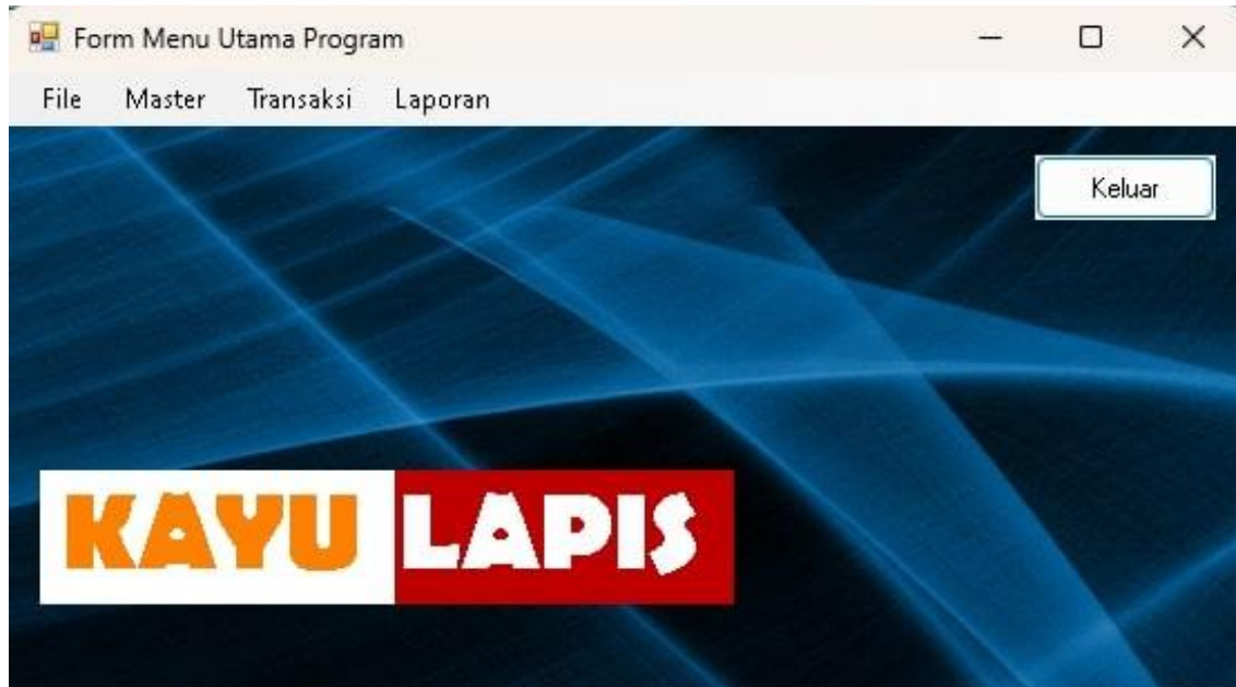
Gambar 8. Menu Utama