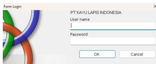
Gambar 9. Halaman Log IN