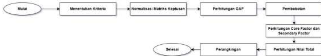
Gambar 1. Prosedur Penelitian

Prosedur Penelitian ini memberikan alur setiap proses dalam sistem yang akan dibuat.