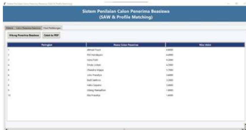
Gambar 4. Halaman Hasil Perhitungan

Menampilkan luaran dari proses penilaian setelah metode SAW dan Profile Matching diaplikasikan. Fungsionalitas “Hitung Penerima Beasiswa” memicu proses komputasi untuk menghasilkan peringkat ini, dan “Cetak ke PDF” memungkinkan ekspor hasil penilaian ke dalam format dokumen portable.